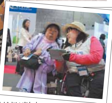
一緒に取材して下さったのは、地元大阪の皆さん。たくさんの製品を見て、触って、試して、レポートしていただきました。

ように見たのでしょうか。『昨年と比べて展示されている製品数が少なかったように思いますが、もう少し改良したらもっとよい製品になるのにと、思ふものもたくさんありました。』 さまざまな企業の方々が丁寧