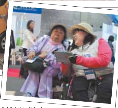
一緒に取材して下さったのは、 地元大阪の皆さん。たくさんの製品 を見て、触って、試して、レポートしていただきました。